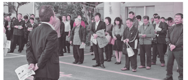
沖縄分会退社時集會もよう（城間ビル）

NTT西日本グループを取り巻く厳しい環境下での闘いとなった今次春闘において、職場集会の開催、連日の待機行動、情報共有化に向けたニュー