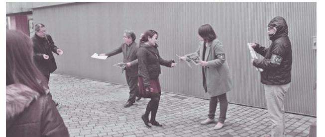
天神・NM九州・FT九州分会合同でビラ配布（天神ビル）

ス配布——等、各分会役員はもとより、組合員の一系列れぬ団結による具体的な闘争戦術行使等に敬意を表する。なお、今次春闘の具体的な総括については、全国大会等に向け、別途行なうこととする。